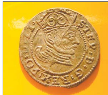
Срэбная манета XVI стагоддзя з выявай Стэфана Баторыя свабодна прадаецца на сайце Аy.by за 3 млн рублёў.

— Велізарная колькасць людзей з металадэтэктарамі наносіла шкоду менавіта тым помнікам, дзе меліся рэчы з каляровымі металамі, — упэўнены намеснік дырэктара па навуковай працы Інстытута гісторыі Вадзім ЛАКІЗА. — Іх цікавіла найперш тое, што затым можна было прадаць на аўкцыёнах. Неаднаразова чорных капальнікаў лавілі на тых месцах, якія ўключаны ў дзяржаўны спіс гісторыка-культурнай спадчыны. Неяк на такіх аб'ектах злавілі людзей з металадэтэктарамі, якія дайшлі да