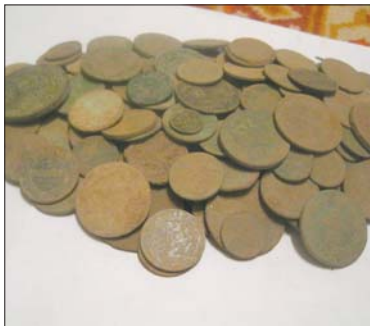
«Царскія манеты з зямлі». Уладальнік гатовы пераслаць іх і ў Расію.

Многія капальнікі сцвярджаюць, што «паляванне» на археалагічныя артэфакты — для іх любімая справа. Выязджаючы за межы гарадоў, здабываючы рэдкія карты, знаходзячы цікавыя прадметы, яны нібы «дакранаюцца да мінулага». Аднак калі зняць ружовыя акулёры і паглядзець на сітуацыю больш рэалістычна, можна ўбачыць, што за такой забавай часта хаваецца проста імкненне да нажывы. І размежаваць гэтыя два полюсы капальніцтва даволі цяжка.